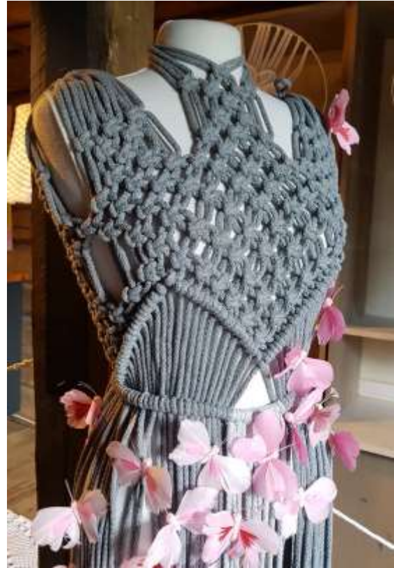
Onni elää makrameessa oli Kenkäveron juhluvuoden näyttely 1.6.-30.10.2020

Saimaa brändin vahvistaminen yhdessä muiden toimijoiden kanssa on ollut aktiivista koko vuonna.