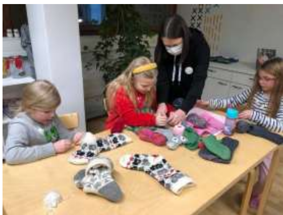
Kuva Pieksämäen käsityökoulusta.