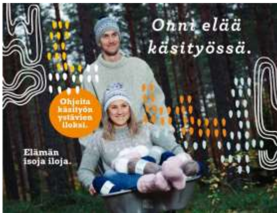
Ohni elää käsityössä -ohjelehteä jaettiin asiakkaalle ilmaiseksi ikään kuin lohtulahjana.

Avustuksella käynnistettiin kurssitoiminta kesäkurseilla ja tehtiin opetusvideoita. Hankittiin uusia tietokoneita ja sähköisiä näyttöjä, joiden avulla etäopetusta voitiin järjestää huomattavasti aktiivisemmin kuin ennen. Lisäksi tehtiin syksyn opetuskaudelle uusi neulemallisto, jonka ohjeiden avulla asiakkaat pystyivät harrastamaan käsitöitä omatoimisesti. Mallisto sai hyvän vastaanoton ja toimintatapaa päätettiin jatkaa myös keväällä.