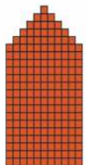
Peukalo 11 s